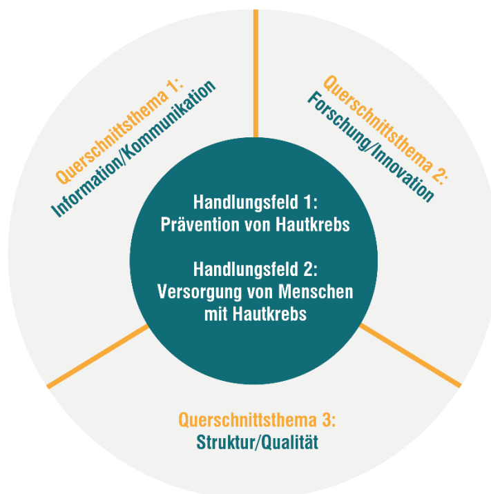
Abbildung: Strukturelle Ausrichtung der NVKH