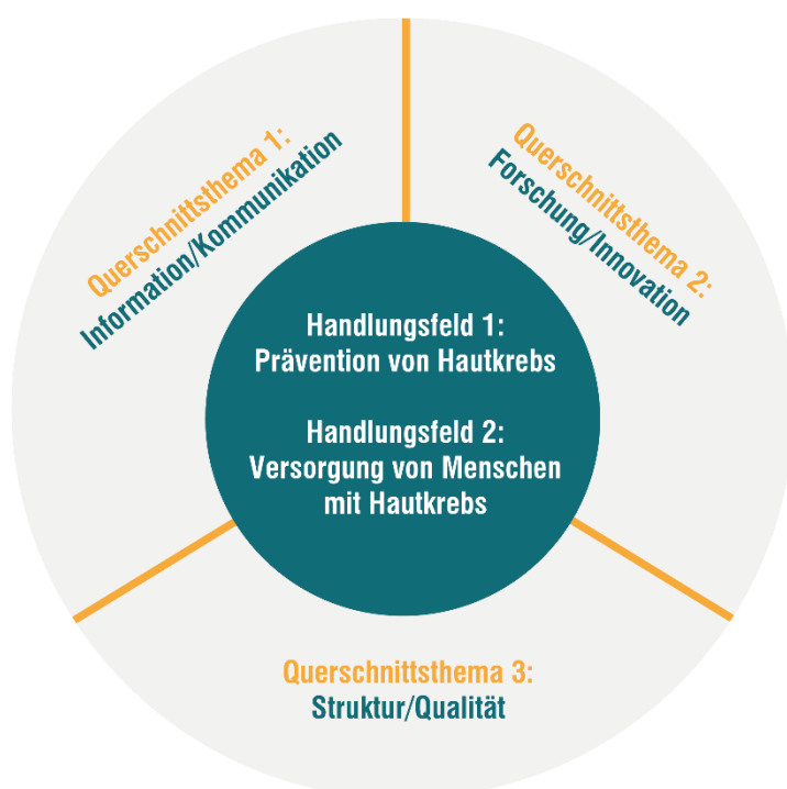
Abbildung: Strukturelle Ausrichtung der NVKH (seit 2020)